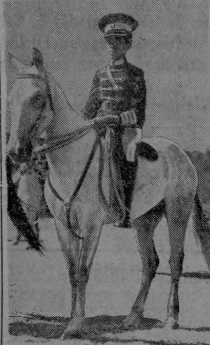
Nos muestra la foto la figura del segundo hijo del Emperador etíope, Duque de Harrar, quien presencia a caballo una revista militar.